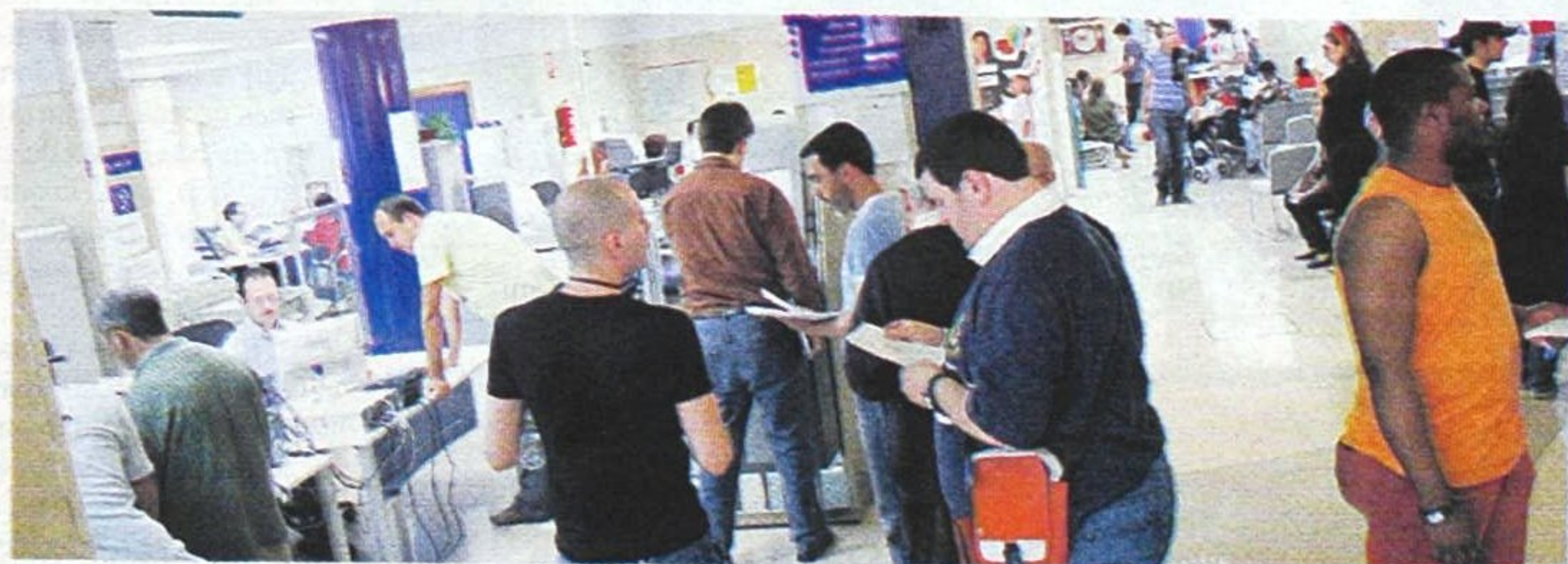
Colas en las oficinas del Servicio Regional de Empleo en Murcia registradas en la mañana de ayer.