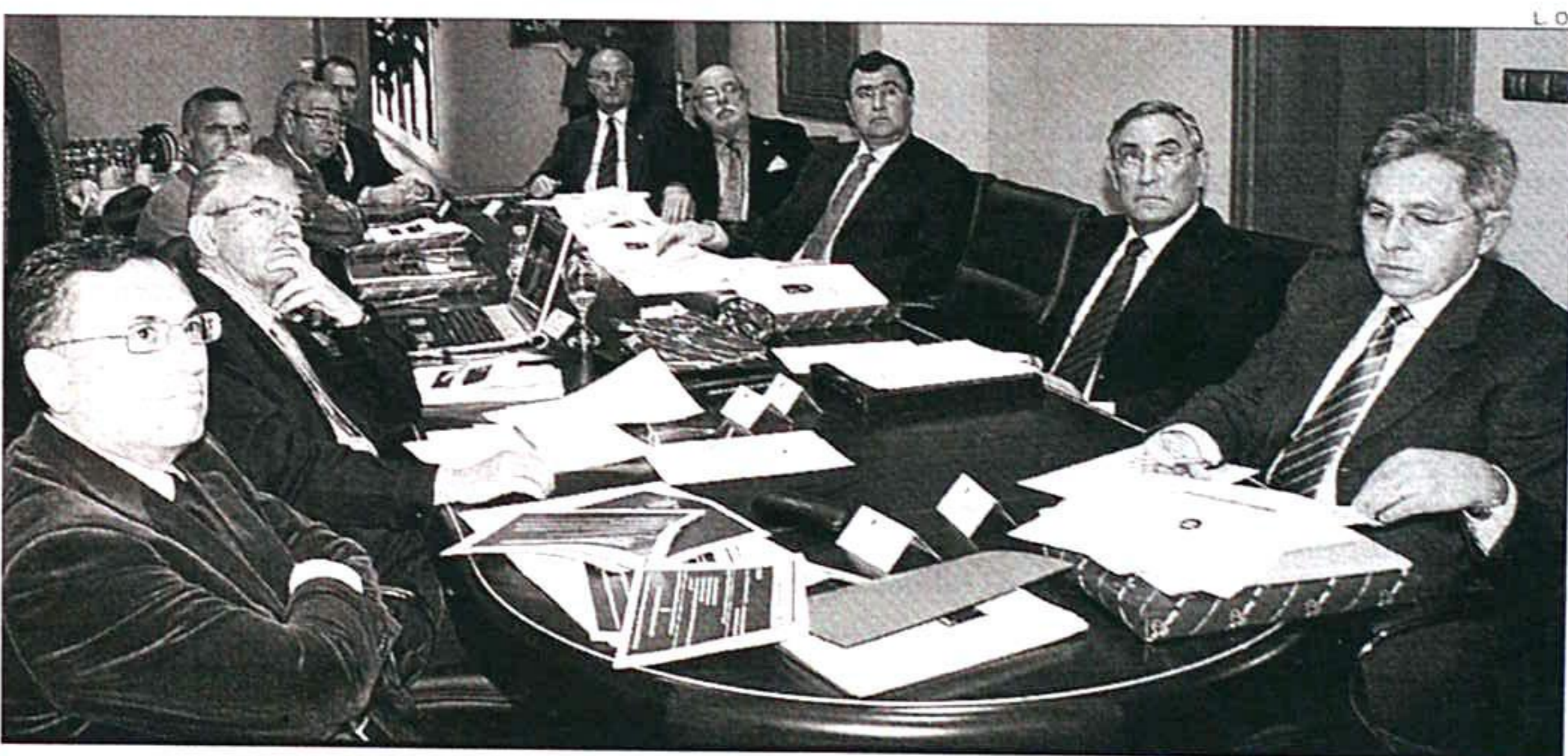
Un momento de la reunión mantenida por los representantes del FERRMED en la Región

El eje FERRMED repercute sobre más del 50% de la población y más del 60% del PIB de la UE. Además, su pleno desarrollo per-